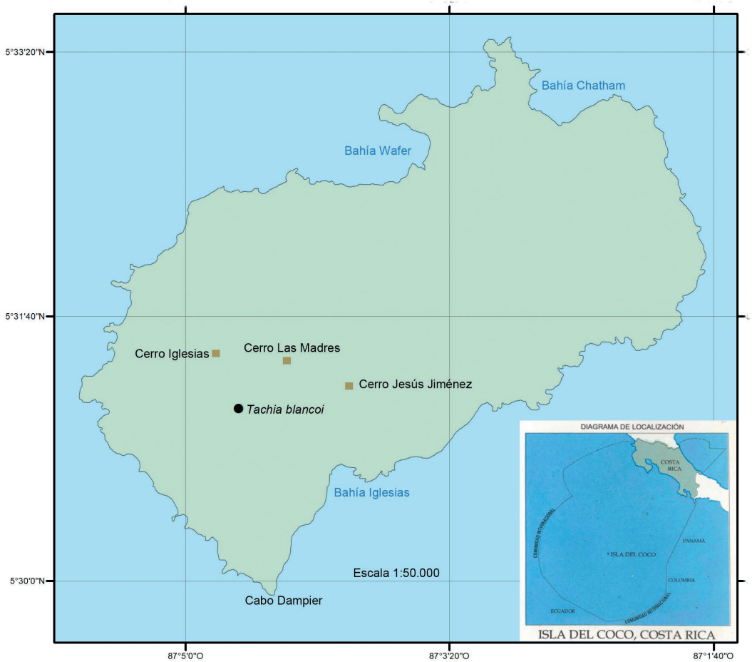
FIG. 3. Mapa de distribución de Tachia blancoi Al. Rodr. & J. Sánchez-Gonz., sp. nov., en la Isla del Coco, Costa Rica. Datum WGS84. Diagrama de localización tomado de IGNCR (2000). Realizado por Joaquín Sánchez.

Las plantas vivas tienen nudos, entrenudos, yemas y peciolos recubiertos de una capa superficial de aspecto ceroso que les otorga una coloración conspicuamente blanco amarillenta (en ramitas distales a partir de los últimos 2–4 nudos), de manera similar, las hojas muestran manchas pálidas e irregulares en la superficie adaxial. Esta capa cerosa y de coloración conspicua observada en los especímenes vivos al ser sometida al proceso de secado se funde y se hace indistinta como tal, pero se transforma en una resina lustrosa y transparente, solo observable en los especímenes secos. Es posible que esta sustancia esté relacionada a protección contra herbívoros. Esta característica también ha sido observada en especímenes de T. parviflora . En el Cuadro 1 se presenta una comparación de los principales caracteres morfológicos que permiten distinguir las diferentes especies del género Tachia .